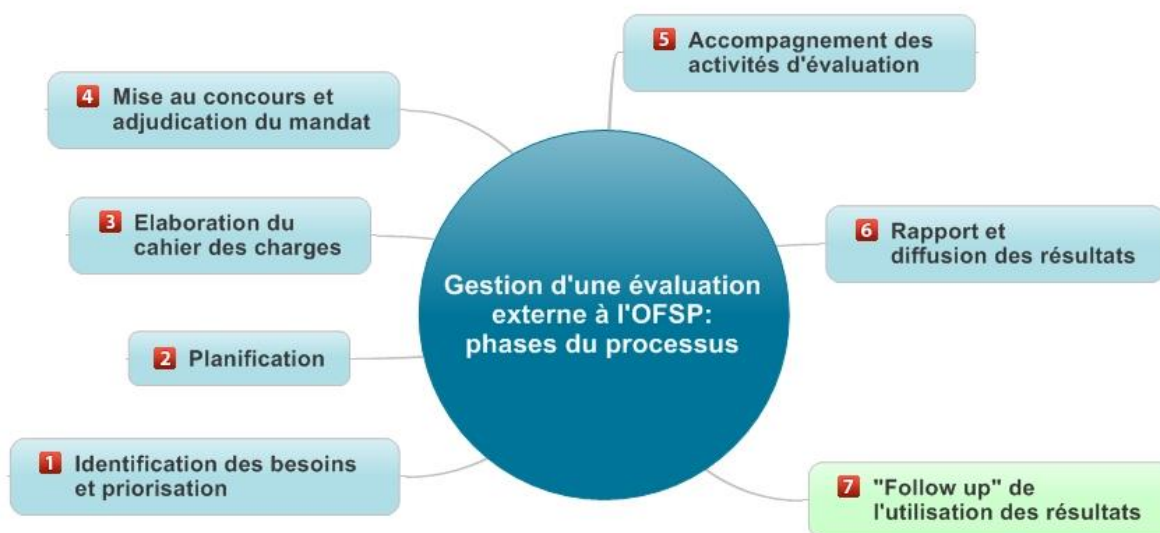
Figure 3 : Les sept phases de la gestion de l'évaluation à l'OFSP

Chaque phase a ses objectifs. Ils sont exposés ci-après.