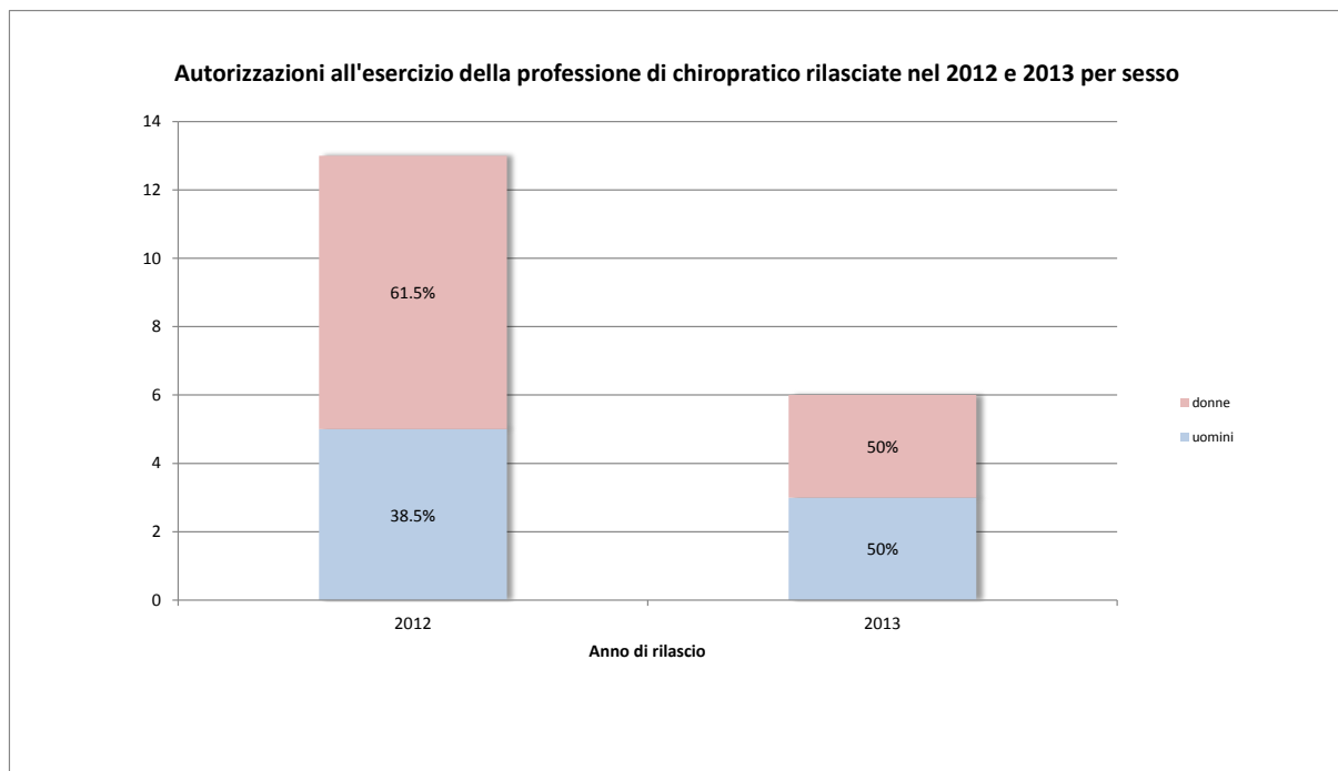
Figura 2: Autorizzazioni all'esercizio della professione rilasciate nel 2012 e 2013 per sesso (Fonte: Registro delle professioni mediche UFSP, stato 30.01.2014)

In questo grafico sono rappresentate le 6 autorizzazioni al libero esercizio della professione di chiropratico rilasciate dalle autorità di vigilanza cantonali nel 2013 (in confronto con il 2012).