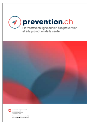
Flyer de la plateforme en ligne prevention.ch PDF : www.prevention.ch

En 2021, la priorité a été le lancement, en mars, de la plateforme en ligne prevention.ch , créée pour et par les partenaires. La plateforme sert de source d'inspiration et de vitrine pour les thèmes MNT, addictions et santé psychique. Elle crée des synergies entre les professionnels et les thèmes. Quelque 180 organisations ont ouvert un compte et peuvent y publier des contenus. Une centaine d'articles paraît chaque mois.