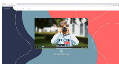
Site du projet Sanateenz Site: www.sanateenz.ch

L'OFSP a par ailleurs chargé la Haute école spécialisée des Grisons de donner la parole aux enfants et aux adolescents. Il en a découlé le projet Sanateenz, jeu de mots composé de Sana (= sain en latin) et teenz (abréviation de teenager). Comment les jeunes perçoivent-ils leur santé, quel est leur mode de vie ? Le quiz permet à tous de se rendre compte de la mesure dans laquelle l'image qu'ils se font des jeunes est juste.