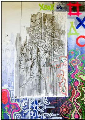
« Visual Protocol » de la conférence nationale des parties prenantes Addictions Site : www.prevention.ch

Outre l'OFSP, divers acteurs participent à la mise en œuvre de la stratégie nationale Addictions (offices fédéraux, cantons, communes, ONG, associations professionnelles). En septembre 2021, l'OFSP et le Réseau Santé Psychique ont mené une conférence nationale des parties prenantes sur le thème prioritaire « Santé des enfants et des adolescents », sous le titre « Des enfants et des adolescents plus forts ! » ( www.bag.admin.ch ). Celle-ci était centrée sur la prévention des addictions, la santé psychique et les répercussions du COVID-19 sur les adolescents. La réunion de différentes disciplines et l'usage des synergies est indispensable pour concevoir des offres adaptées aux enfants et aux adolescents.