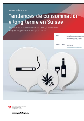
Cahier thématique « Tendances de consommation à long terme en Suisse » PDF: www.bag.admin.ch

Un cahier thématique présentant la consommation de tabac, d'alcool et de drogues illégales de 1992 à 2016 montre comment la consommation évolue au cours de la vie humaine: par exemple, la population suisse boit autrement aujourd'hui qu'il y a 25 ans.