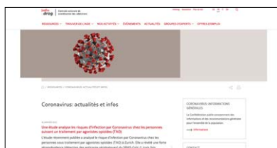
Actualités sur le coronavirus (Infodrog) Site: www.infodrog.ch

La pandémie de coronavirus a conditionné la vie quotidienne, ce qui a amené les acteurs du domaine des addictions à renforcer leur collaboration. La task force « Addictions et Covid-19 » a mis au point du matériel d'information propre à ce contexte (gestes de protection, accès au matériel de protection et vaccination contre le COVID-19). Le site Internet d'Infodrog contient des actualités sur le coronavirus.