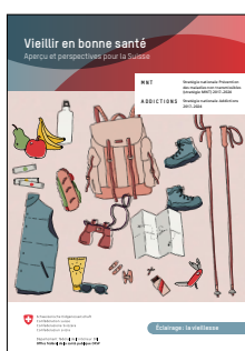
Brochure « Vieillir en bonne santé » PDF: www.bag.admin.ch

En 2019, la stratégie nationale Addictions a été mise en œuvre sous le thème prioritaire « Vieillir en bonne santé » . En mai 2019, l'OFSP et l'organe responsable de la stratégie MNT ont organisé une conférence nationale des parties prenantes sur ce nouveau thème prioritaire. À cette occasion, des projets non seulement liés à ces deux stratégies, mais aussi relevant du domaine « Santé psychique », ont été présentés. L'OFSP a publié un numéro de spectra dédié au thème « Vieillir en bonne santé » ainsi qu'une brochure axée sur les faits et chiffres. Cette dernière comprend des données sur l'état de santé des personnes âgées en Suisse et sur leur comportement en matière de santé, et soulève des questions concernant les représentations de la vieillesse au sein de la société. Elle aborde également des sujets spécifiques aux addictions qui peuvent aller de pair avec des événements critiques vécus au troisième âge. Enfin, elle met en lumière les défis inhérents aux soins prodigués aux personnes âgées sévèrement dépendantes.