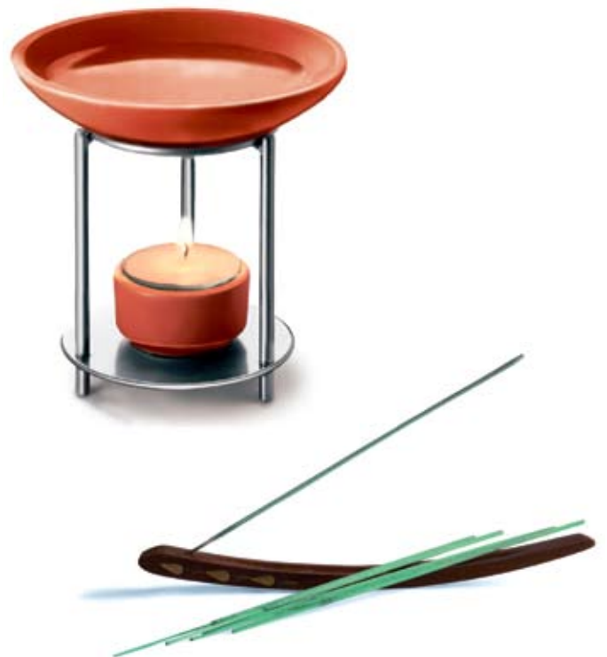
Dépliant « Aérer ou parfumer? », Office fédéral de la santé publique