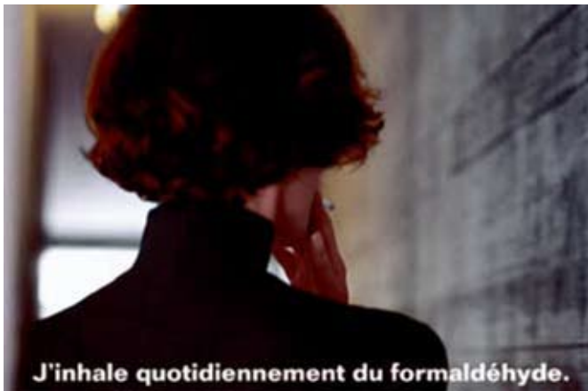
Campagne de prévention du tabagisme de l'OFSP 2003 (extrait d'une annonce)