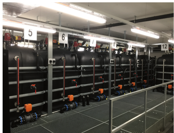
Esempio di un impianto di controllo delle acque di scarico.

Prima dello svuotamento deve essere nota l'attività contenuta nel serbatoio. Essa va determinata tramite misurazione o calcolo prudenziale. Quest'ultimo metodo prende in considerazione l'afflusso di attività generato dalle attività utilizzate durante il periodo di riempimento. In entrambi i casi il metodo deve essere verificato e approvato dall'autorità di vigilanza. Lo svuotamento deve essere verbalizzato (tempo di immissione, volume e attività specifica dei nuclidi), rispettando le attività di immissione massime specificate nella licenza d'esercizio.