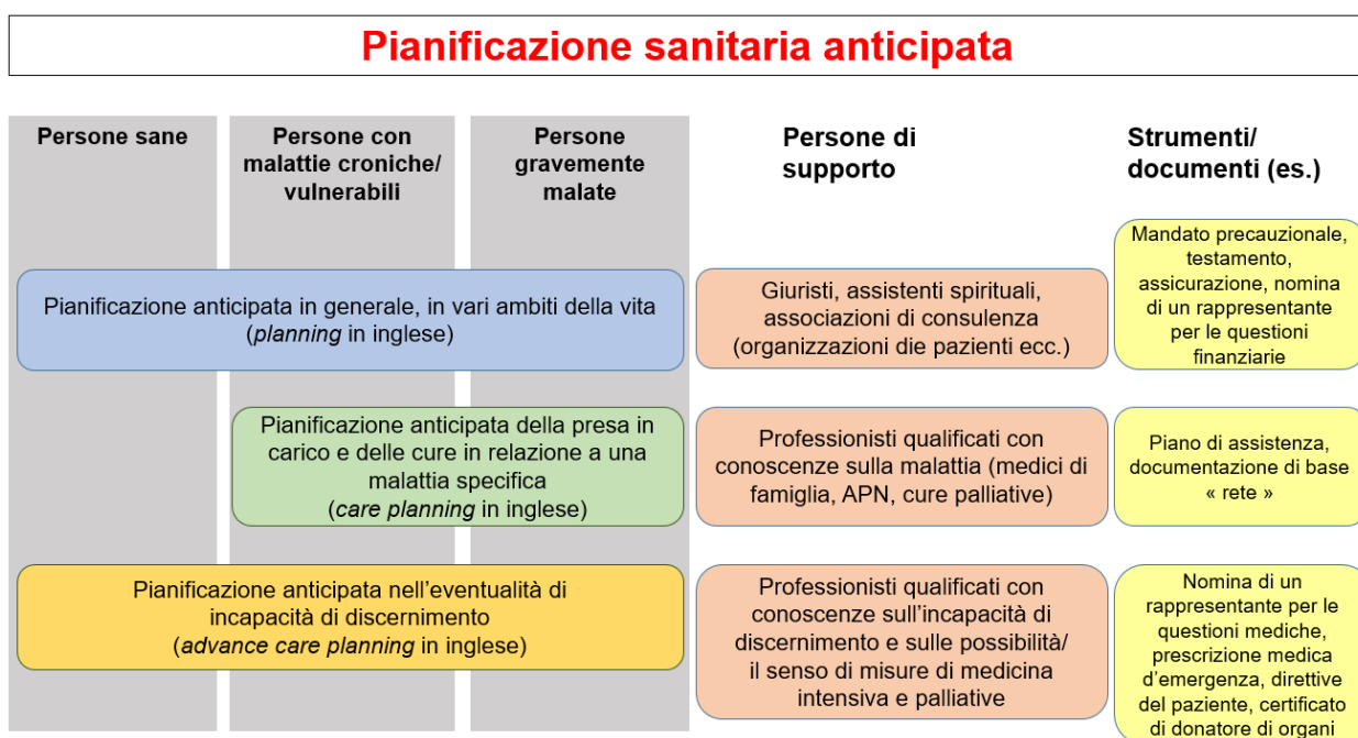
Figura: livelli della pianificazione sanitaria anticipata

Il coordinamento regionale dei diversi fornitori di prestazioni che partecipano alla rete di cura è fondamentale per garantire che la pianificazione anticipata avvenga secondo le preferenze degli interessati. Per l'implementazione è indispensabile tenere conto delle prestazioni richieste nei corrispondenti sistemi di remunerazione.