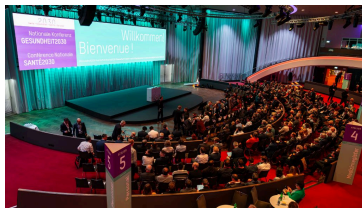
Conferenza nazionale Sanità2030

DigiSanté è regolarmente presente agli eventi sulla digitalizzazione nel settore sanitario, per esempio alla Conferenza nazionale Sanità2030 organizzata dall'UFSP nel primo trimestre del 2024, interamente dedicata alla digitalizzazione.