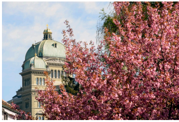
Palazzo del Parlamento - vista esterna

Siamo lieti di comunicarvi che, durante la sessione primaverile 2024, il Consiglio nazionale ha approvato il credito d'impegno per DigiSanté nella votazione sul complesso e che anche la Commissione della sicurezza sociale e della sanità del Consiglio degli Stati ha raccomandato all'unanimità di approvarlo.