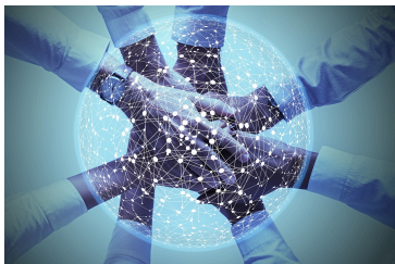
Immagine simbolo Cooperazione

La fase di inizializzazione del programma prosegue. La creazione dell'organizzazione del programma e dei canali di partecipazione dei portatori di interessi costituisce le fondamenta del programma.