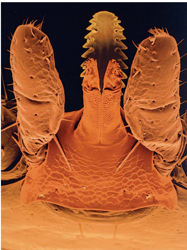
Abbildung 2: Stechapparat (Rostrum) der Zecke