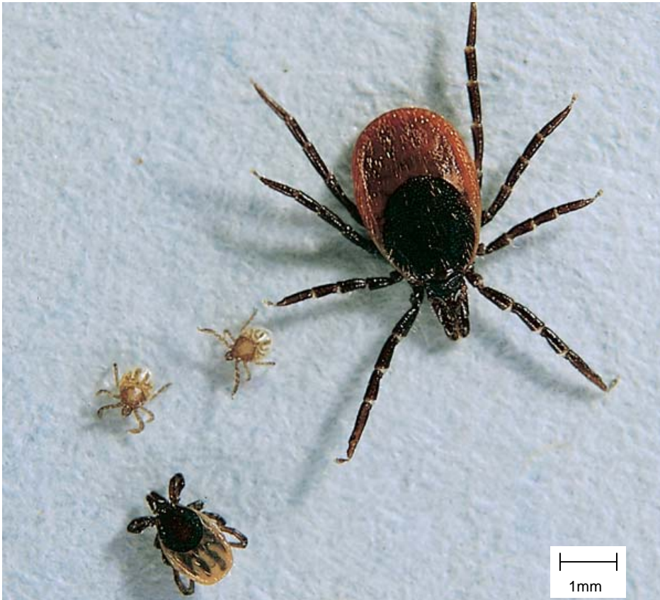
Abbildung 1: Ixodes ricinus (Holzbock): Zeckenstadien