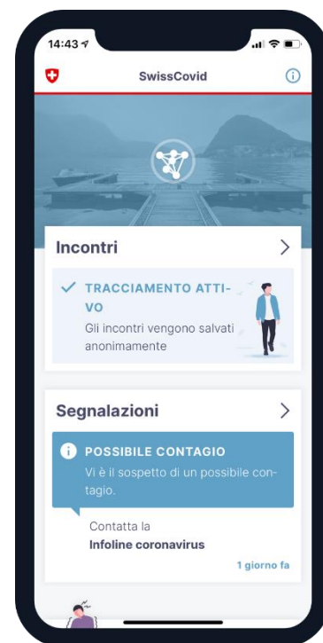
Fig. 1: raffigurazione dell'app SwissCovid di un potenziale contatto con un caso di COVID-19

Le persone asintomatiche che hanno avuto uno stretto contatto con un caso di COVID-19 e sono state messe in quarantena dalle autorità possono anch'esse essere testate (PCR o test sierologico). L'indicazione viene effettuata dall'autorità cantonale competente (medico cantonale o servizio di tracciamento dei contatti incaricato da quest'ultimo). I medici cantonali possono inoltre prescrivere, quando ciò sia giustificato e in deroga alle suddette prescrizioni, di fare testare delle persone asintomatiche (PCR e/o test sierologico), per indagare e controllare la diffusione del virus nell'ambito di un focolaio. Per quanto concerne i costi, la Confederazione assume quelli delle analisi di biologia molecolare (PCR). Per le analisi sierologiche, la