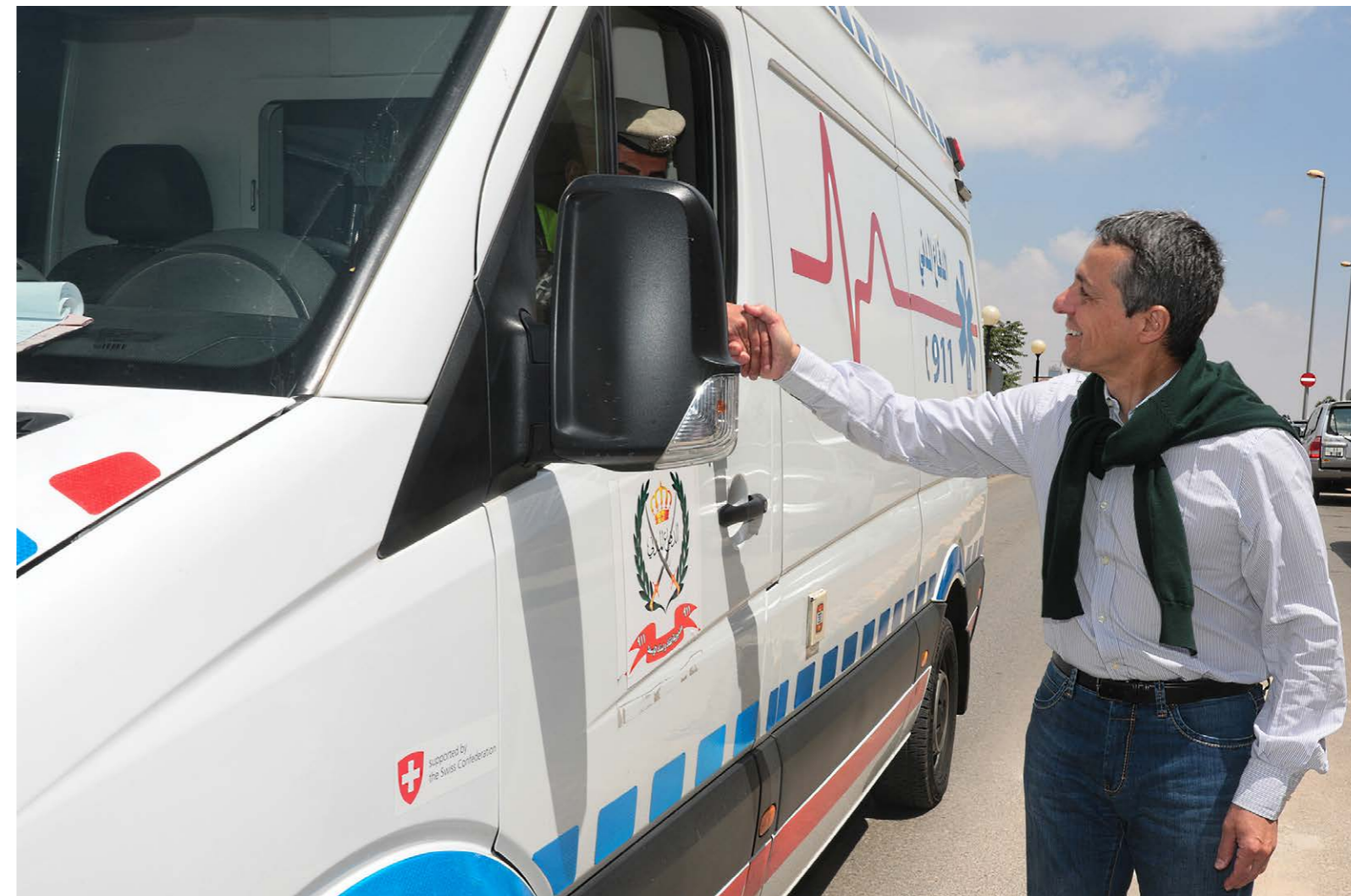
Il Consigliere federale Ignazio Cassis visita un progetto di cooperazione nel settore sanitario finanziato dalla Svizzera. Amman, Giordania, maggio 2018.

ambiti d'intervento stabiliti consentono agli organi federali coinvolti l'impiego coerente ed efficace delle risorse esistenti.