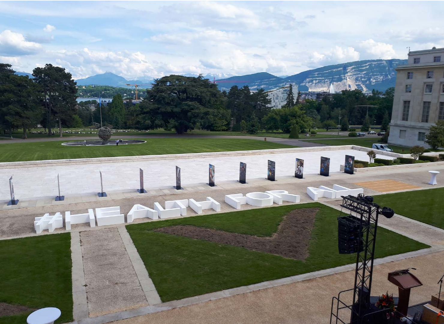
Commemorazione del 70° anniversario dell'Organizzazione mondiale della sanità (OMS), Ufficio delle Nazioni Unite a Ginevra, maggio 2018. In quanto sede dell'Organizzazione mondiale della sanità e di una miriade di altri attori impegnati nel campo della salute, la Ginevra Internazionale è un importante centro di governance nel campo della salute globale.

In passato, in Svizzera, come nella maggior parte degli altri paesi, le questioni afferenti alla politica ed assistenza sanitaria rappresentavano primariamente un tema di politica interna. Costituiscono un'eccezione le crisi sanitarie transfrontaliere che richiedono da sempre una concertazione a livello internazionale. Le malattie trasmissibili come la tubercolosi, l'HIV, l'Ebola, l'infezione da virus Zika o l'influenza aviaria, per esempio, hanno evidenziato solo recentemente l'importanza della collaborazione internazionale. Nello stesso tempo, negli ultimi trent'anni, i paesi di tutto il mondo hanno capito che la salute della popolazione è fondamentale sia dal punto di vista della politica di sviluppo sia da quello economico. La salute ha pertanto acquisito una dimensione politica sempre più rilevante, diventando oggi un punto fermo dell'agenda internazionale.