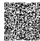
针对有症状人员的隔离指令