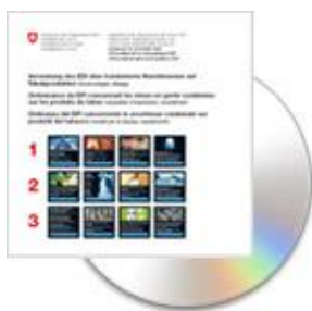
Fig. 4 CD-ROM avec mises en garde imagées de haute résolution

Les images accompagnant les produits du tabac destinés à être fumés et les modèles de mises en page peuvent être commandés gratuitement auprès de l'OFSP. La condition préalable consiste à ce que l'entreprise s'enregistre auprès de la Direction générale des douanes en tant que distributeur de tabac et soit en mesure de communiquer le numéro de revers attribué par l'Administration des douanes.