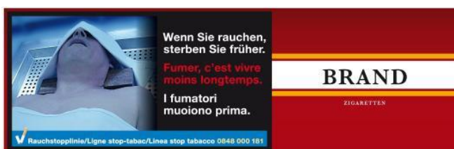
Fig. 2 Cartouche de 10 paquets de cigarettes (verso)