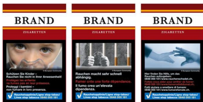
Fig. 1 Trois paquets de cigarettes

Les mises en garde en allemand, en français (en rouge) et en italien couvrent, entre autres, les sujets suivants : protection des enfants contre le tabagisme passif, dépendance, soutien lors du sevrage et décès prématuré.