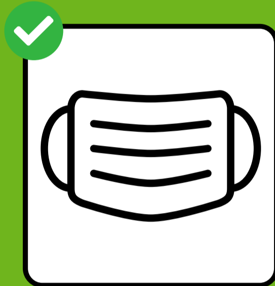
ናይ ገጽ ማስኬራ ተኸደን።