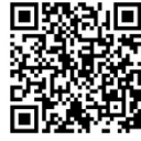
ኡጋት ጽፊትን ኣደብን (እንግሊዝኛ)