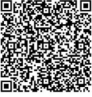
መምርሒ ምግላል (እንግሊዝኛ)