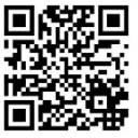
ሓድሽ ኮሮናቫይረስ (እንግሊዝኛ)

እዞም ዝስዕቡ መምርሒታት፡ ኣብቲ ትውሸቡሉ እዋን፡ ምትሕልላፍ ቫይረስ ንምውጋድ ክተተግብርዎም ዘለኩም ናይ ጥንቃቄ ስጉምትታት ይሕብሩኹም፡፡ ኩሉ ኣገዳሲ ሓበሬታ ብዛዕባ እዚ ሓድሽ ኮሮናቫይረስ ኣብዚ ክትረኽቡ ትኸእሉ፡- www.bag.admin.ch/neues-coronavirus (ብቋንቋ ጀርመን፡ ፈረንሳይ፡ ፕሊያን፡ እንግሊዝ)፡፡