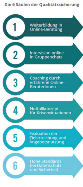
Abbildung 2: 6 Säulen der Qualitätssicherung