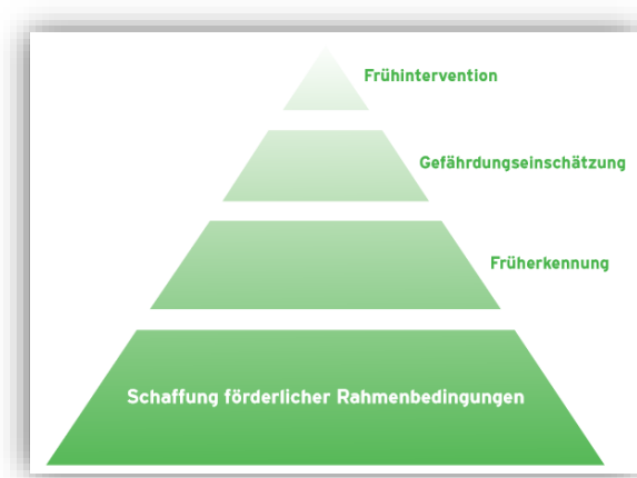
Abbildung 2: «Die Pyramide der Früherkennung und Frühintervention: vier unterschiedliche Phasen». Aus: Avenir Social et al. (2016): Charta der Früherkennung Frühintervention (S. 2).

Die von einem Dutzend Organisationen aus dem Sucht-, Sozial- und Gesundheitsbereich getragene Charta definiert neun Punkte einer wertschätzenden und engagierten Grundhaltung bezgl. Früherkennung und Frühintervention bzw. gegenüber den betroffenen Personen.