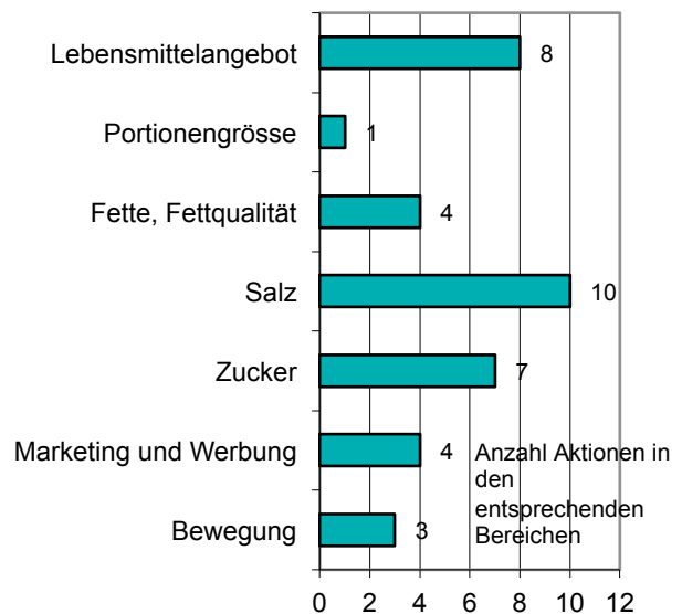
C) Thematische Schwerpunkte der Aktionen der an actionsanté beteiligten Unternehmen (37 Aktionen von 23 beteiligten Unternehmen, Stand Ende 2016)

Bei den Aktionen im Bereich Marketing und Werbung gilt es zu berücksichtigen, dass es sich bei Swiss Pledge um eine Initiative mit 13 Unterzeichnern handelt.