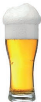
1 Stange Bier (3 dl)

Wenn Sie Alkohol trinken, halten Sie auf jeden Fall auch alkoholfreie Tage ein und nehmen Sie dazu immer kohlenhydrathaltige Mahlzeiten ein.