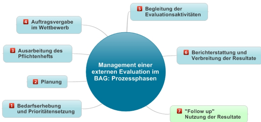
Abbildung 3: Die sieben Phasen des Evaluationsmanagements im BAG