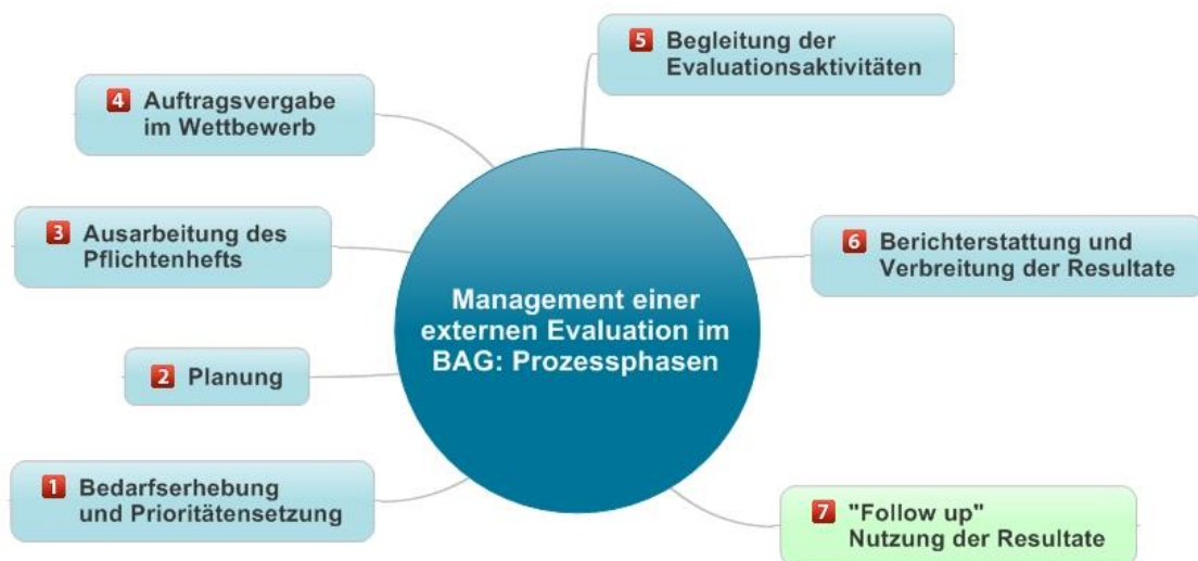
Abbildung 3: Die sieben Phasen des Evaluationsmanagements im BAG