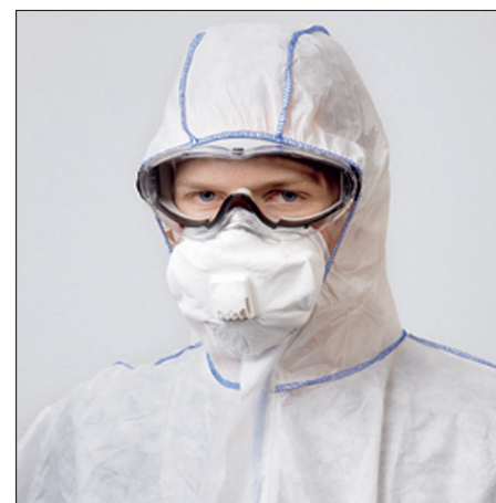
Partikelfiltrierende Halbmaske des Typs FFP3.