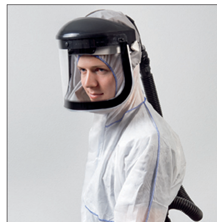
Gebläseunterstützte Atemschutzhaube THP mit einem Partikelfilter P3.