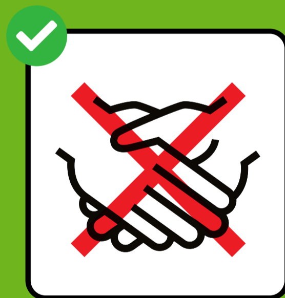
Unikanie podawania ręki.