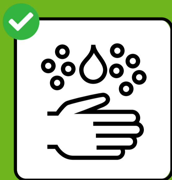
Dokładne mycie lub dezynfekcja rąk.