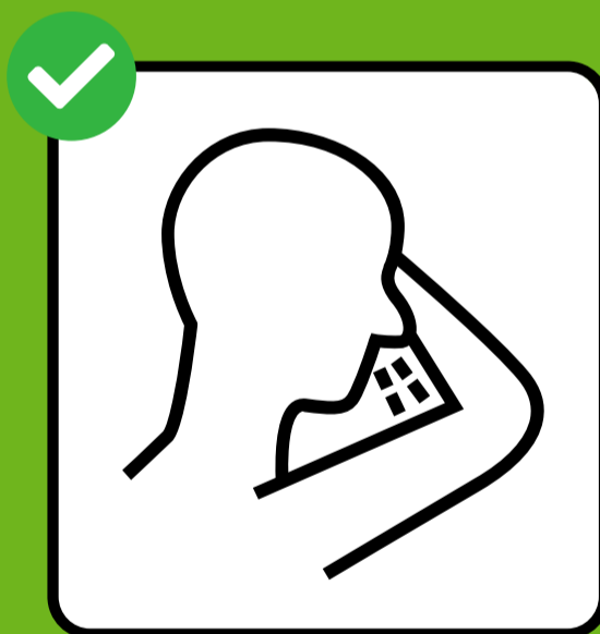
Kasanie i kichanie w chusteczkę lub zgięcie łokcia.