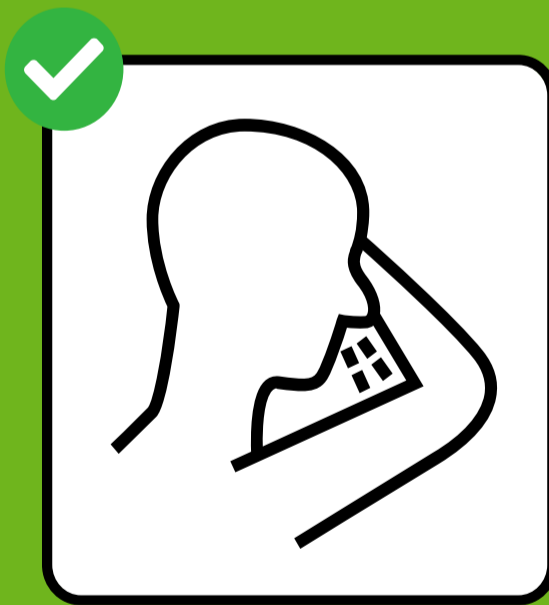
咳嗽或打喷嚏时注意用纸巾或 用胳膊肘挡住。