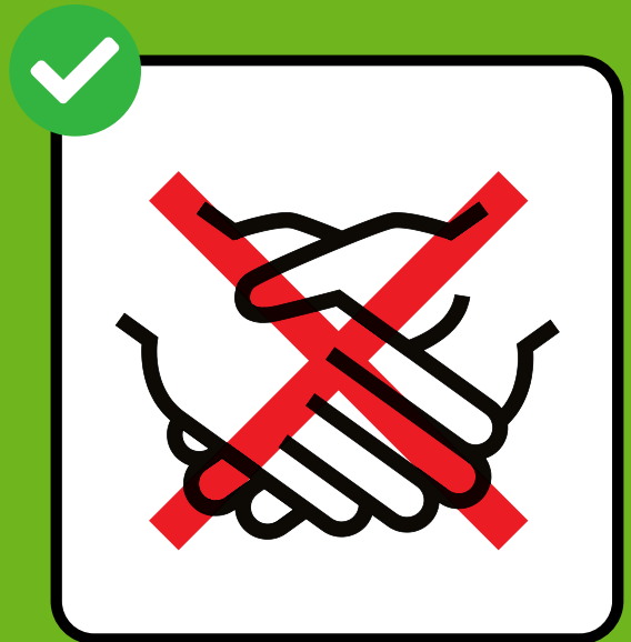
እጅ ከመጨባበጥ ተቆጠብ ።