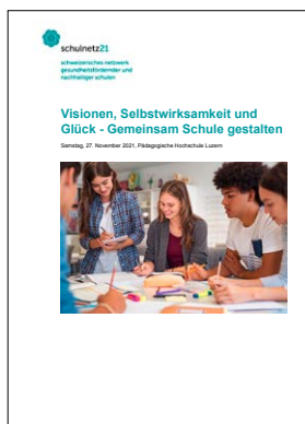
Programm der Impulstagung PDF: www.schulnetz21.ch

BAG und Gesundheitsförderung Schweiz (GFCH) sind Träger vom Schulnetz21 (Schweizerisches Netzwerk gesundheitsfördernder und nachhaltiger Schulen). Als jährlicher Höhepunkt fand im November 2021 die Impulstagung zum Thema «Visionen, Selbstwirksamkeit und Glück: Gemeinsam Schule gestalten» statt ( www.schulnetz21.ch ). Sie vernetzt die Mitglieder der jeweiligen Sprachregion. Des Weiteren haben die Träger die Evaluation von Schulnetz21 gestartet.