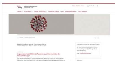
Newsticker zum Coronavirus (Infodrog) Webseite: www.infodrog.ch

Der Alltag wurde von der Coronavirus-Pandemie mitbestimmt. Aus diesem Grund verstärkten die Akteure im Suchtbereich ihre Zusammenarbeit. Die Taskforce «Sucht und Covid-19» erarbeitete settingspezifisches Informationsmaterial (z.B. zum Schutzverhalten, zum Zugang zu Schutzmaterial und zur Covid-Impfung). Der Newsticker zum Coronavirus auf der Webseite von Infodrog informierte laufend über die Aktualitäten.