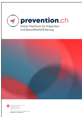
Flyer der Online-Plattform prevention.ch PDF: www.prevention.ch

Der Schwerpunkt im Jahr 2021 lag auf der Lancierung der Online-Partnerplattform prevention.ch im März 2021. Die Plattform dient als Inspirationsquelle und Schau- fenster für die Themen NCD, Sucht und Psychische Gesundheit. Sie schafft Synergien zwischen den Fach- personen und den Themen. Rund 180 Organisationen haben ein Konto erstellt und können Inhalte publizieren. Monatlich entstehen rund 100 Artikel.